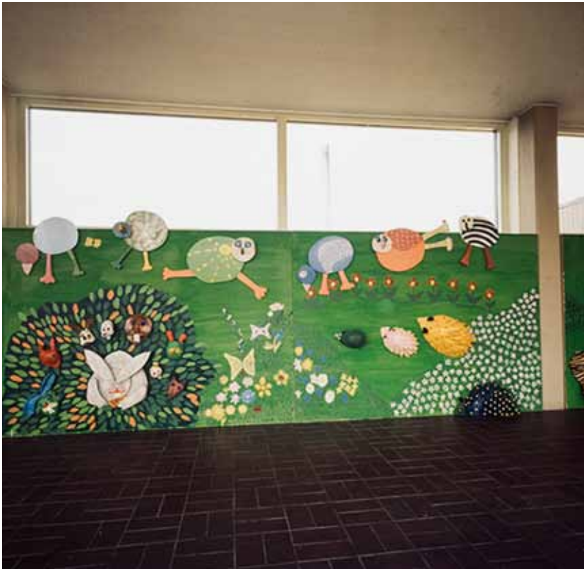
Päivi Ernkvist, Långbro sjukhus (Ungdomskliniken), Stockholm, 1971–72. 4 meter av den 20 meter långa väggen.