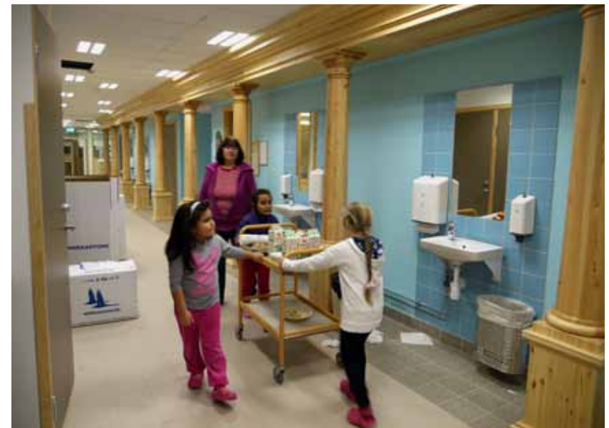
Pontus Lindvall, "Kolonnad i klarlackad furu", Akalla grundskola, 2012–13. Uppdragsgivare: Stockholm konst.